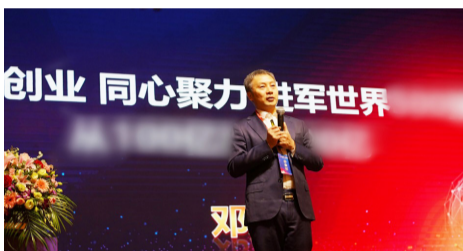
董事长邓成作“二次创业 同心聚力 进军世界级企业”报告